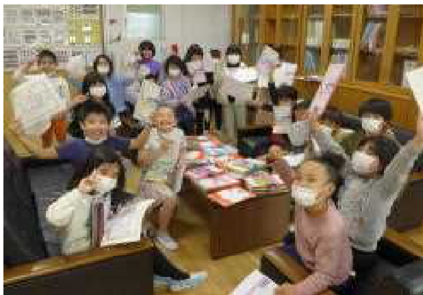
○ 達成賞の賞状と記念のノートを手元に元気に応える：2年生

○昨日は、4年生がかがやきノート6冊達成できたと多くの4年生が校長室へ、賞状とノートを受け取りに来てくださいました。今日は2年生とまた、組違いの4年生が来ました。低学年の2年生も、よく頑張ってくださいました。