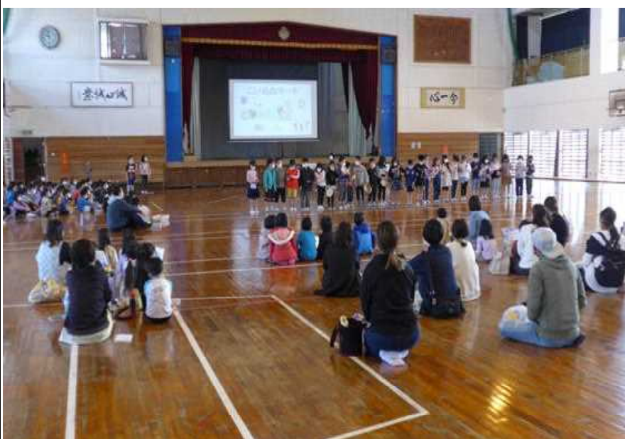
○幼稚園児を前に、子犬のマーチを楽しく楽器を演奏する：1年生

○ 4月に入学予定の新一年生(現幼稚園児)を招いてのお招き会を実施しました。現一年生は、この日のために、今まで練習を頑張ってきました。国語や算数のお勉強の説明や体育や音楽など小学校の勉強や生活をとっても上手の発表していました。とても、上手でした。