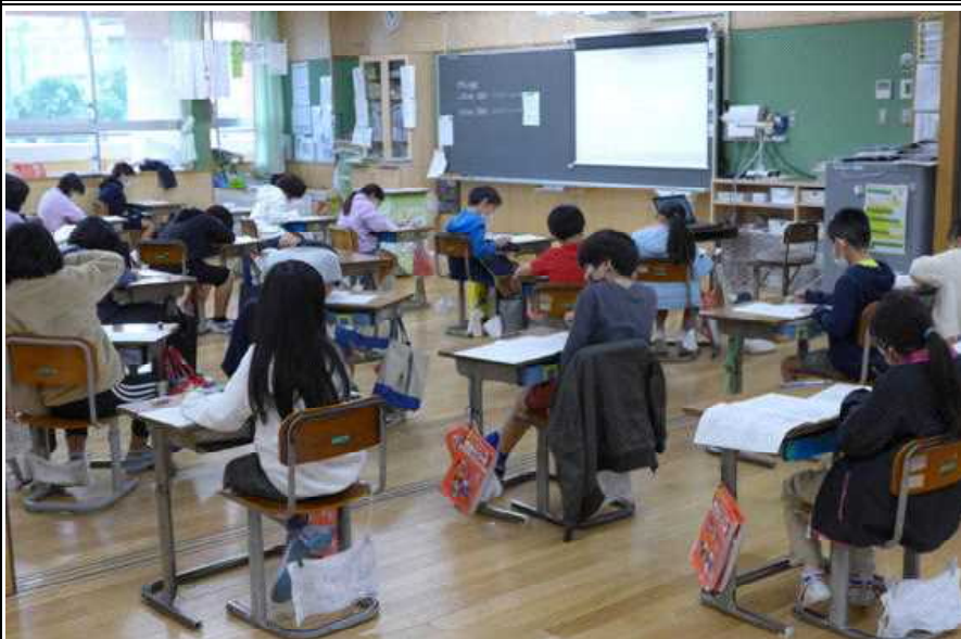
○これどんなだったかなと、最後の問題まであきらめず解く：3年生

○ 今週の火曜日の6年生に続いて、今日は、3年生、4年生が実力テストに挑戦しました。この学年で学んだ事をどの程度定着しているかを図るテストです。最後まであきらめず解いていました。