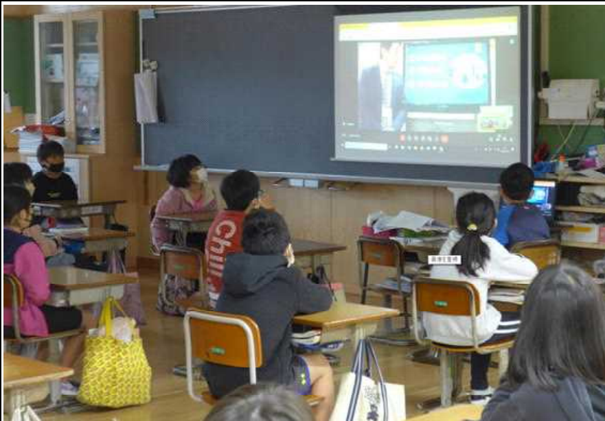
○ 校長講話をリモート画面を見ながら、真剣に聞く：3年生

○ 今年度最後の校長講話です。これまで、様々な分野からお話しましたが、今年のテーマは「心」についてです。冬期オリンピックに絡めながら、「目に見えないものこそ、本当に大切」というキーワードで話しました。子ども達も、真剣に聞いてくれました。