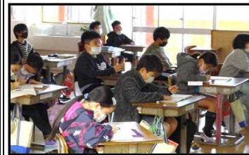
メモを取りながら話を聞く子どもたち

○ 今年度最後の校長講話です。これまで、様々な分野からお話しましたが、今年のテーマは「心」についてです。冬期オリンピックに絡めながら、「目に見えないものこそ、本当に大切」というキーワードで話しました。子ども達も、真剣に聞いてくれました。