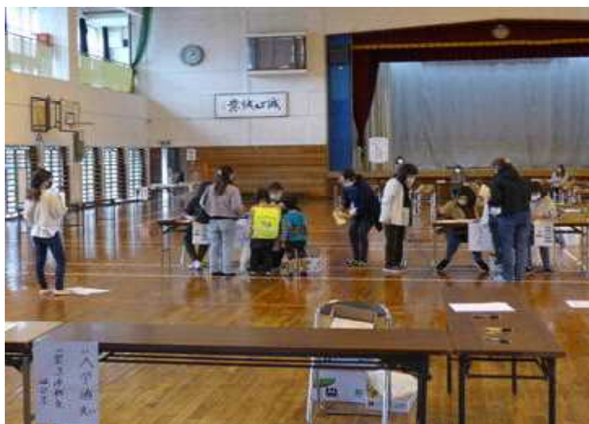
○お子さまの入学説明会に参加する：保護者の皆さま

○昨日は、中学校の先生方が赤道小学校の6年生の授業参観に来てくださり、今日は次年度の新一年生への保護者へ入学説明会を開催しました。コロナ禍の状況下ですが、全体会を省いて、個別に対応を行いました。2月に入り、次年度に向けて、着々と進んでいます。会場の準備は、6年生の児童が頑張ってくれました。