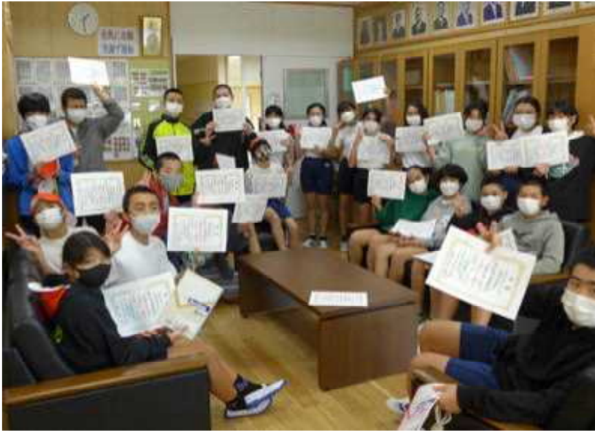
○ 輝きノートの目標を達成し、賞状を手に笑顔で応える：6年生

○ 4月から中学生になる六年生です。小学校最後の輝きノートの目標冊数を達成した児童が大勢、校長室に来ました。一人一人賞状を受け取り、頑張った笑顔を見せてくれました。小学校で学び続けた取組む力を中学校でも生かして欲しいと思います。よく頑張りました。