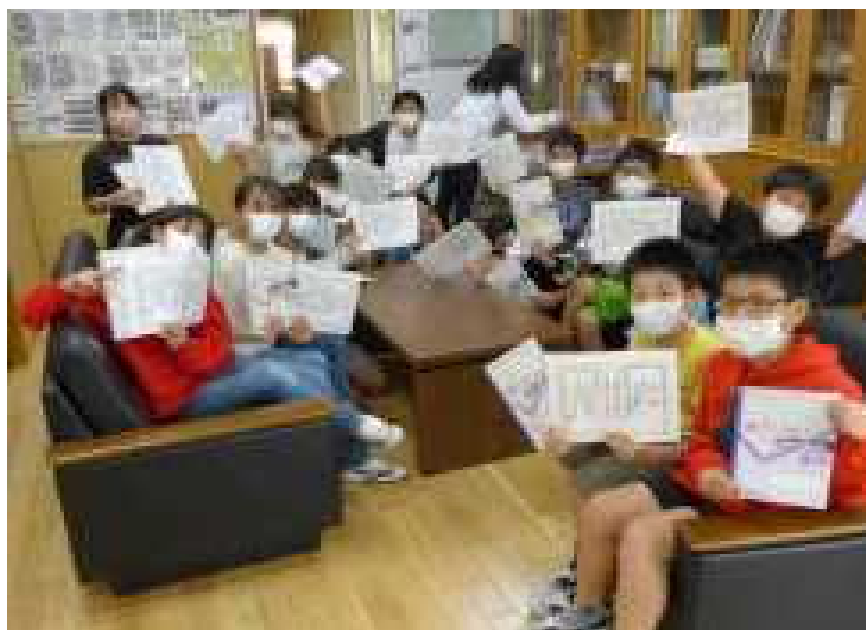
○ 達成賞の賞状と記念のノートを手笑顔で応える：4年生

○今年も、家庭学習を頑張ってお組んでくれた赤道っこに、達成賞とノートのプレゼントを行っています。多くの子どもたちが目標に向かって取り組んでいます。今日も校長室には、達成した子ども達が大勢で訪ねてきました。どの子ども、自分の頑張りを笑顔で話していました。