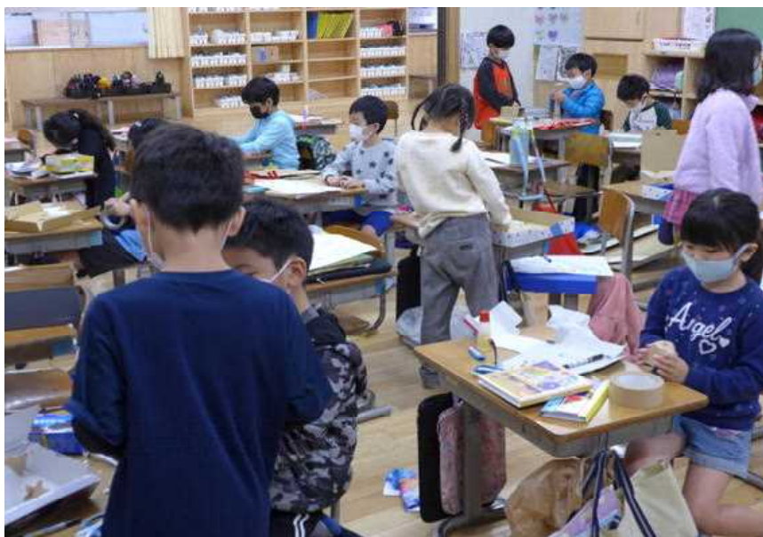
○廃材を利用して友だちと工夫して、スゴロク作りを楽しむ：2年生

○2年生の図工の時間です。何を作っているのかなあと、ぞいて見るとスゴロクを作っていました。前もって設計図を考えて、今日は組み立てていました。どの子も、自分の作品と友だちの作品を比べながら、話し合っ作っていました。段ボールなど廃材を利用したスゴロクはオリジナル感があり素敵でした。