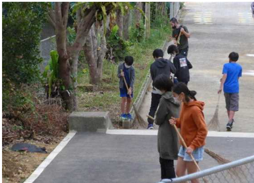
○ 担任の先生も一緒に、朝の清掃活動を頑張る：6年生

○朝の登校時に、子ども達が気持ちよく登校して欲しいと思い、毎朝6年生が、子ども達が通る校内の清掃を行っています。