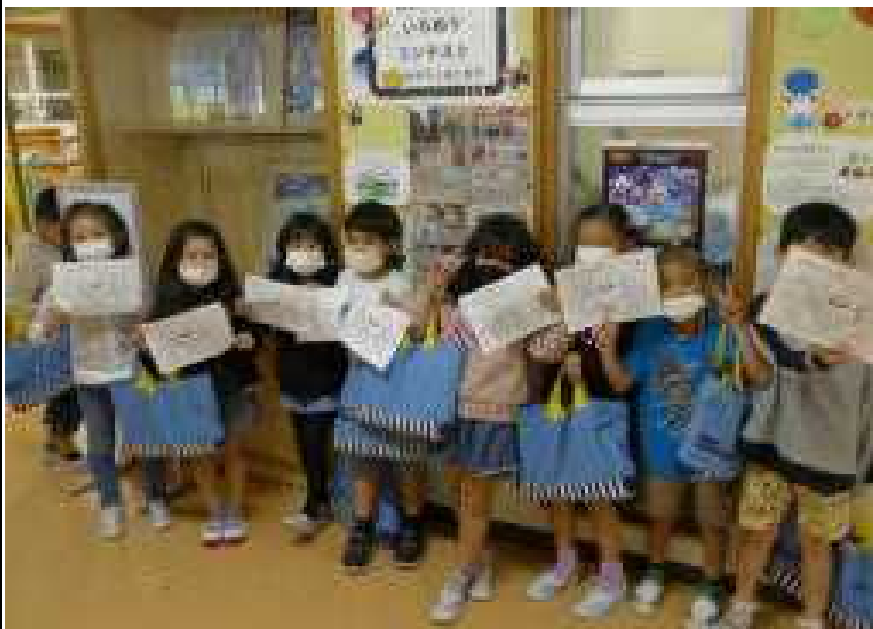
○色ぬりコンテストに向けて、応募作品を手に笑顔で応える：1年生