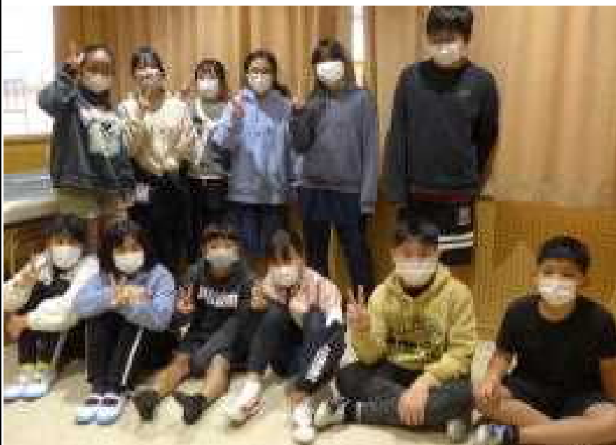
○学校の元気印。みんなに元気な声を届ける：放送委員会引き継ぎ

○ これまで学校の中心、顔として学校を引っ張り、リードしてきた6年生から新たに学校のリーダーになる5年への委員会引き継ぎ式がありました。