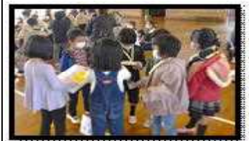
素敵なプレゼントもありました

○ 4月に入学予定の新一年生(現幼稚園児)を招いてのお招き会を実施しました。現一年生は、この日のために、今まで練習を頑張ってきました。国語や算数のお勉強の説明や体育や音楽など小学校の勉強や生活をとっても上手の発表していました。とても、上手でした。