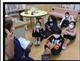
みんなの健康を守る保健委員会

これまでの6年生のように「責任感を持って学校支えて欲しい」という6年生児童代表の挨拶には感動しました。 頑張って5年生!!