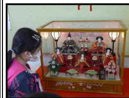
ひな人形をずっと見 つめる 三年女児