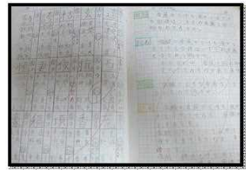
内容も素晴らしいノートです。

○ 4月から中学生になる六年生です。小学校最後の輝きノートの目標冊数を達成した児童が大勢、校長室に来ました。一人一人賞状を受け取り、頑張った笑顔を見せてくれました。小学校で学び続けた取組む力を中学校でも生かして欲しいと思います。よく頑張りました。