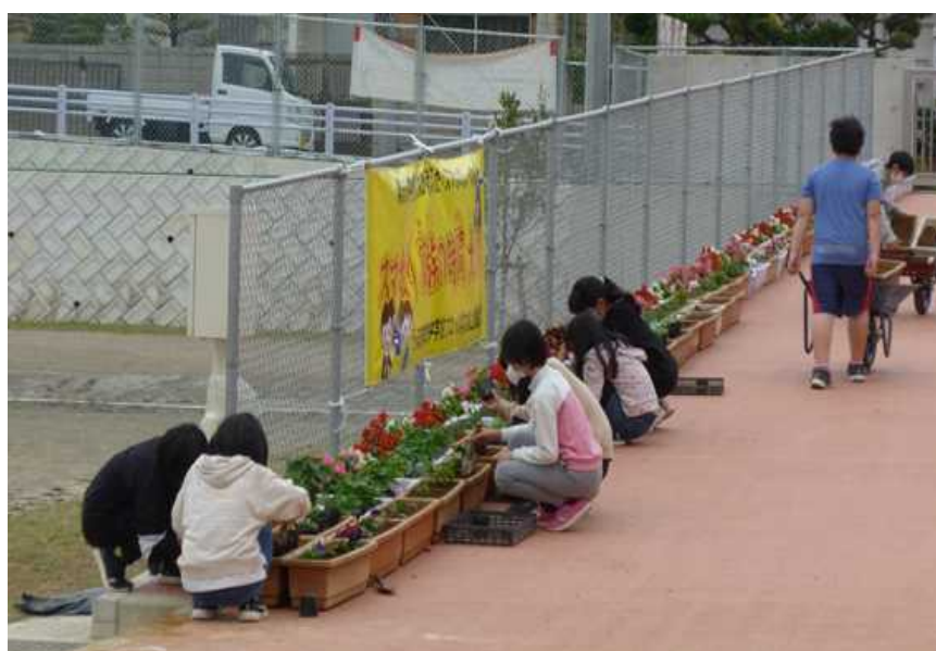
○ 卒業式や入学式に向けて、花の準備を頑張る：5年生

○卒業式や入学式が迫る中、学校ではその準備のために5年生が大活躍です。一人一人が思いを込めて、懸命に花作りに取り組んでいました。「えらいねって」声をかけると「お世話になった6年生のために頑張りたい」となんとも、嬉しい返事が返ってきました。素敵な5年生です!!