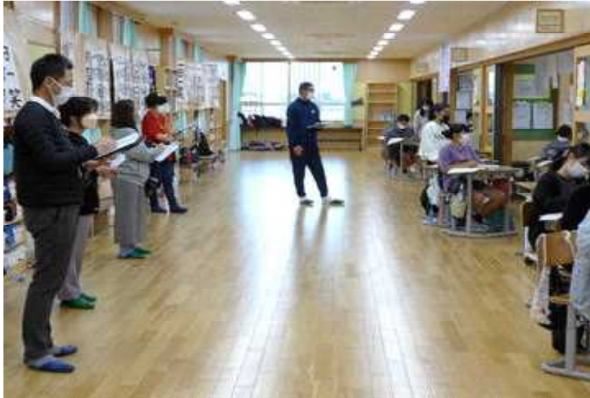
○ 中学校の先生の授業参観に緊張する：6年生

○赤道小学校と具志川中学校とは、様々な面で連携と協力をしています。今日もその一貫で、中学校の校長先生をはじめ、先生方が6年生の授業参観に来られました。もうすぐ中学校へ進学する6年生です。中学校先生方に授業の様子を見ていただき、交流ができました。中学の先生方も頑張る6年生を褒めていましたよ。