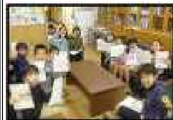
4年生も元気いっぱい!!

○昨日は、4年生がかがやきノート6冊達成できたと多くの4年生が校長室へ、賞状とノートを受け取りに来てくださいました。今日は2年生とまた、組違いの4年生が来ました。低学年の2年生も、よく頑張ってくださいました。