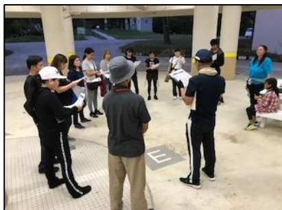
ウォークラリー前の打ち合わせ