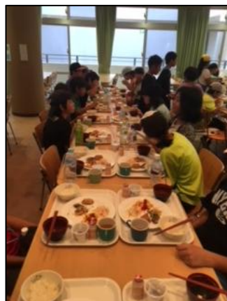
2日目 食堂にて朝食