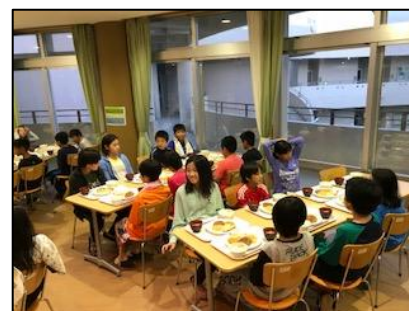
夕食の様子 ※どの子も礼儀よくいただいていた。